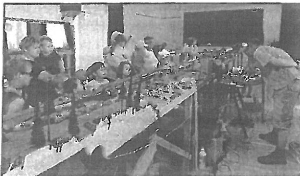
Gyereknapon a Vasútmodell-terepasztal a Kultúrházban