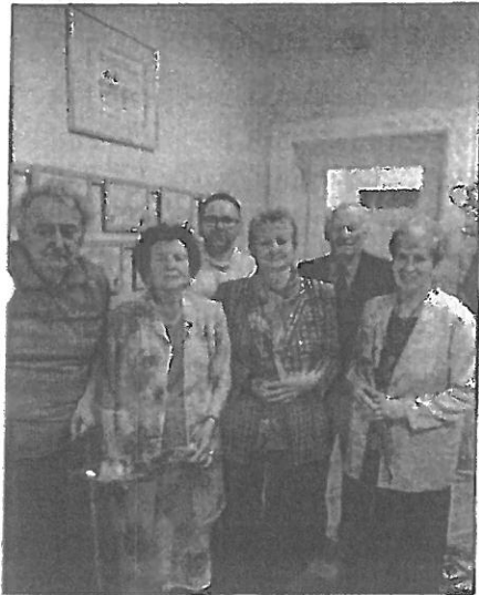
Polgármester úr és a nyugdíjas pedagógusok