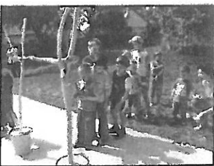
A Gyereknapról a 5. oldalon olvashatnak