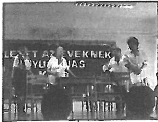
A Nyugdíjas klubról a 4. oldalon olvashatnak