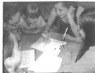
A német nemzetiségi táborról a 2. oldalon olvashatnak.

Gondold el, hogy mi maradna másnak, s milyen nagyon nagy lenne a terhed.