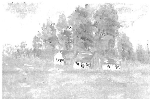
Kovács Jenő festménye